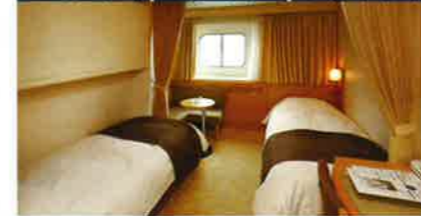
▲コンフォートステート