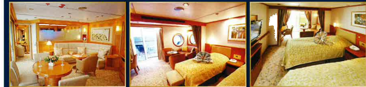
▲グランドスイート【限定2部屋】 ▲ビスタスイート【限定4部屋】 ▲ジュニアスイート【限定3部屋】

スイートクラス | グランドスイート | ビスタスイート | ジュニアスイート | 全室バルコニー、プロバス付バスタブ完備