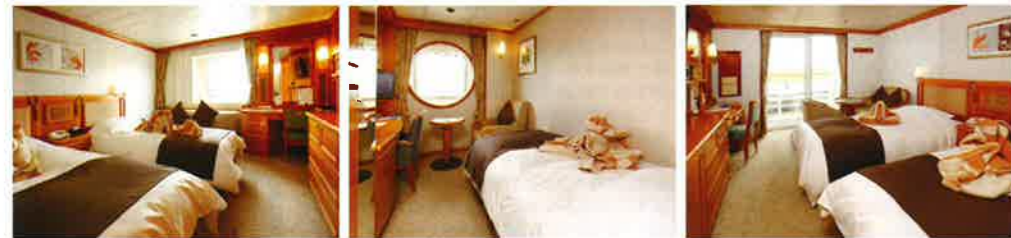
▲デラックスツイン ▲デラックスシングル ▲デラックスベランダ

デラックスクラス | デラックスツイン | デラックスシングル | デラックスベランダ