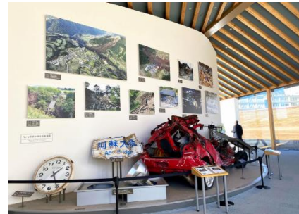
熊本地震震災ミュージアム KIOKU/内観一例