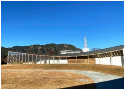
熊本地震震災ミュージアム KIOKU/外観

② 震災の記憶を未来へ繋ぐ熊本地震震災ミュージアムKIOKU(きおく) :「熊本地震震災ミュージアム KIOKU」を訪問し、地震の記録や教訓を学び人と自然の共生について考えていただく機会を得ることができます。