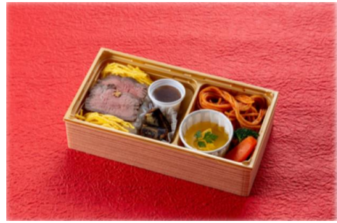
2日目:ONE PIECE 公式バスツアーオリジナル弁当/イメージ