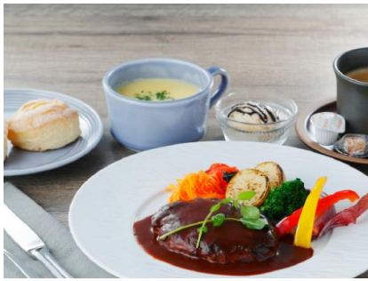
1日目:douce Nucca のランチ/イメージ