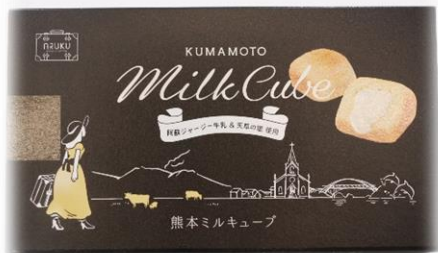
▲「熊本ミルクキューブ」パッケージ(表面)

そして、箱を開封後に見ることができる「熊本ミルクキューブ」をイメージして書かれたストーリーにも注目です。