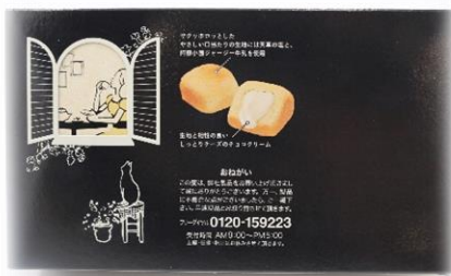
▲「熊本ミルクキューブ」パッケージ(裏面)