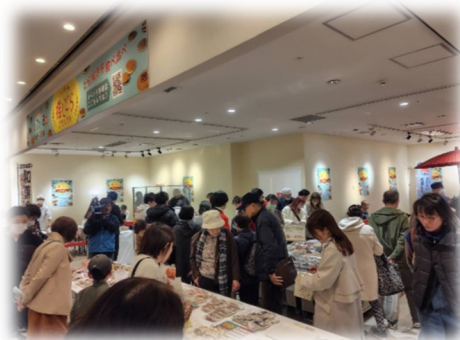
▲イベント当日の会場の様子