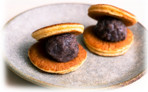
▲あんあんどら焼き(つぶあん)150円(税込)

九州産交リテールでは、今回のイベントを通して、熊本で長く愛されるあんこ菓子の魅力発信に寄与することが出来たことと同時に、今後もさらに“食”を通して熊本を盛り上げてまいります。今後とも皆様のご支援のほどよろしくお願いいたします。