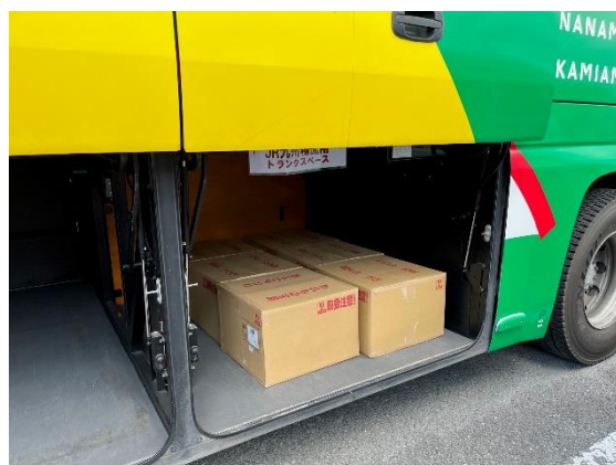
▼バス搭載イメージ