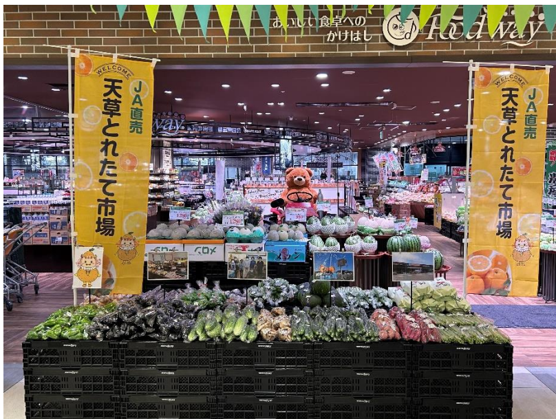
▲マルシェ展開イメージ