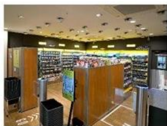
①入店後、欲しい商品を手にする

商品を手に取り、出口でディスプレイの表示内容を確認し、支払いするだけでお買い物が完了します。