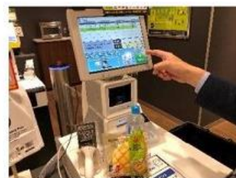
③出口のディスプレイで購入商品を確認して決済