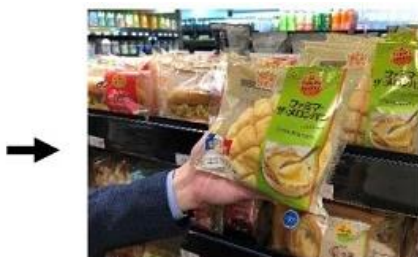
②商品は手持ちのバッグに入れても OK