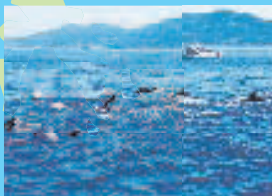
イルカウォッチング

「天草ぐるっと周遊バス」の企画・実施会社は「九州産交ツーリズム(株)天草支店」となります。