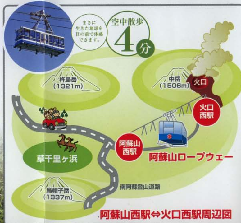
阿蘇山西駅⇄火口西駅周辺図