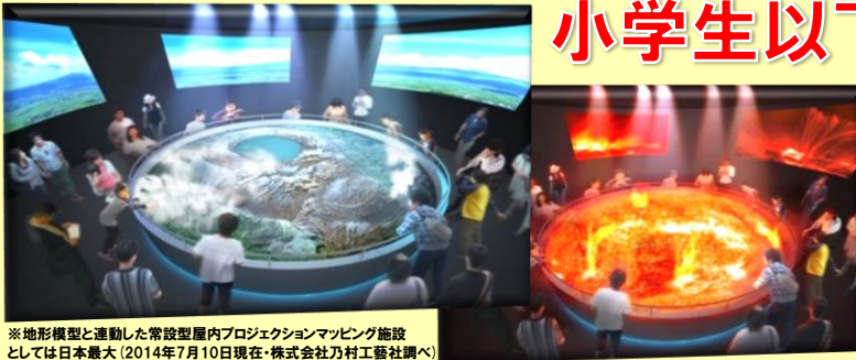
※地形模型と連動した常設型屋内プロジェクションマッピング施設としては日本最大(2014年7月10日現在・株式会社乃村工藝社調べ)

阿蘇の四季折々の美しい自然や太古の火山活動、そして未知の地底を疑似体験できる映像エンターテインメント施設『阿蘇スーパーリング』。ここでしか味わえない絶景を、この機会にお楽しみください！